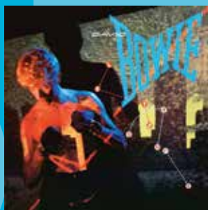
DAVID BOWIE LET'S DANCE (REMASTERED)